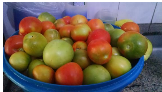
Figura 3. Resultado da colheita