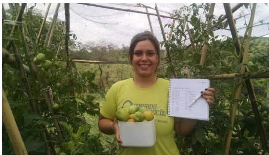
Figura 2. Aspectos do ensaio na época da colheita