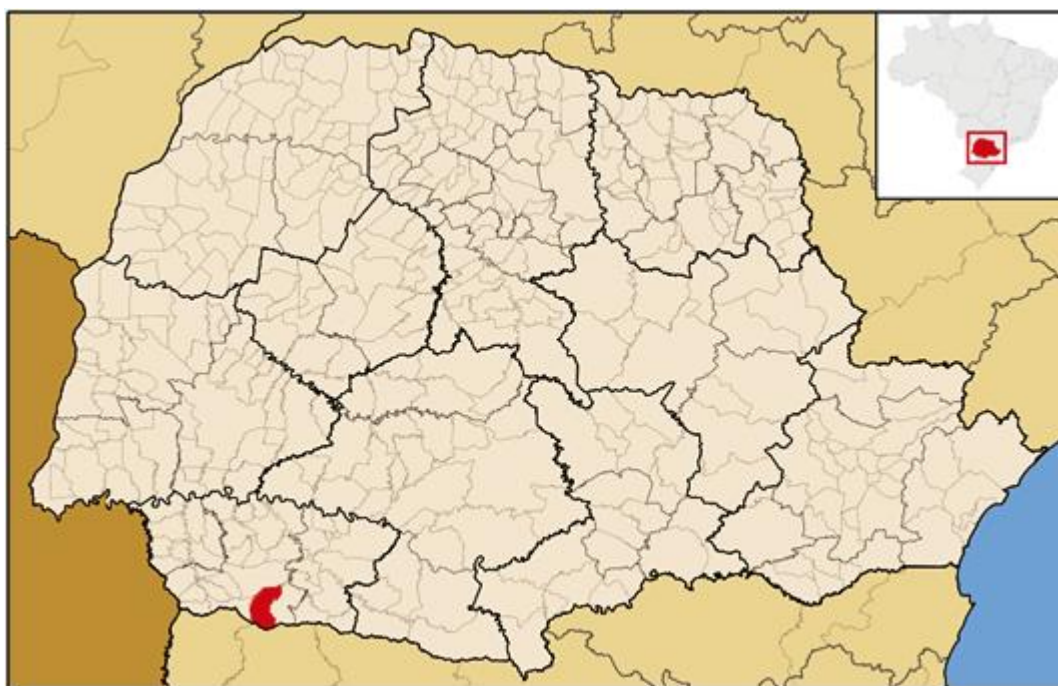
Figura 1. Localização do Município de Marmeleiro – PR.

Segundo a Prefeitura Municipal de Marmeleiro (2014), a economia do município baseia-se principalmente na atividade agropecuária, com indústrias de alumínio, metalúrgicas, indústrias de baterias, indústria moveleira e possui, também, atividades voltadas para o varejo.