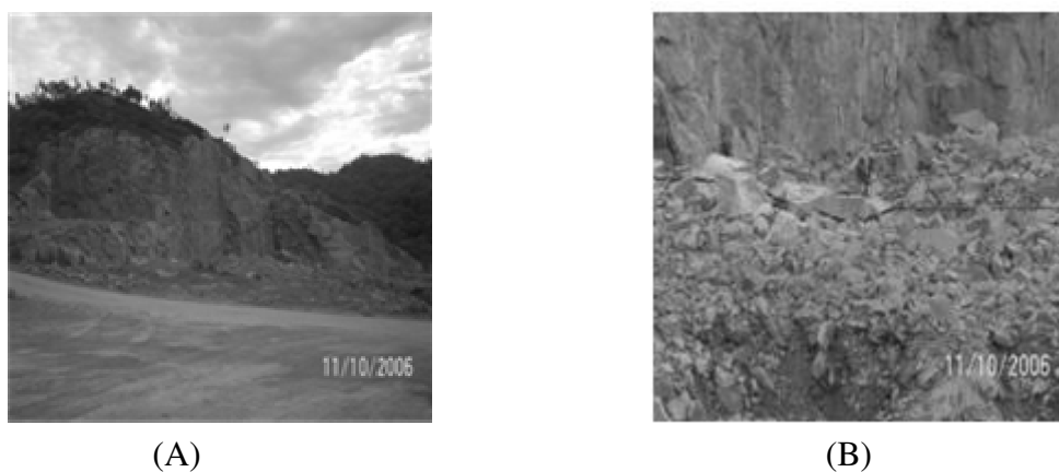
Figura 2. Vista de uma frente de lavras e bancada (A); execução de perfuração para detonação secundária (B).