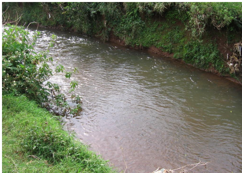
Figura 2. Ribeirão Coati Chico, ponto de coleta ETE.

25° 00' 51" Sul 53° 28' 11" Oeste. Neste ponto a vazão do ribeirão é maior, pois recebe a contribuição de dois afluentes. Pode-se observar o ponto ETE de coleta na Figura 2.