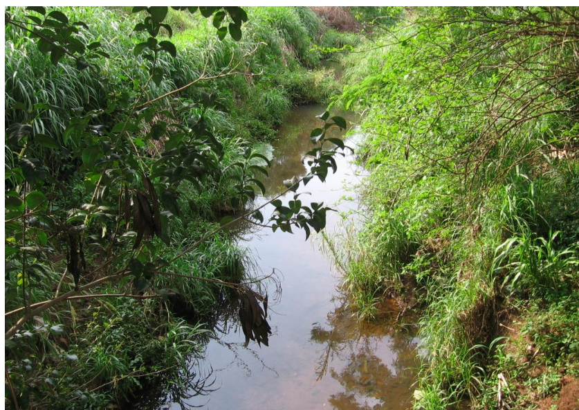
Figura 1. Ribeirão Coati Chico, ponto de coleta Cuiabá.

As coletas foram realizadas em dois pontos distintos do ribeirão. O primeiro ponto, denominado ponto Cuiabá, localiza-se na região urbana do município e possui como localização geográfica as seguintes coordenadas: 24° 57' 56" Sul e 53° 28' 34" Oeste. Próximo a este ponto, o ribeirão recebe várias descargas clandestinas de esgoto doméstico não tratado da população ribeirinha e efluente de algumas indústrias de pequeno porte. O ponto de coleta Cuiabá pode ser observado na Figura 1.