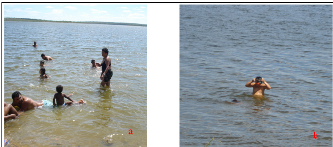
Figura 4ab: Lazer de contato primário praticado em diversos pontos do açude Soledade.

máximo 1.000 coliformes fecais (termotolerantes), índice que sempre foi ultrapassado durante todo o estudo.