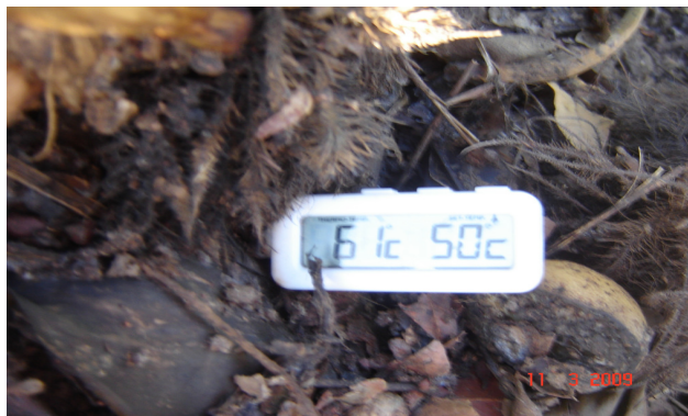
Figura 1. Leitura da temperatura interna da leira com termômetro digital.

A análise de variância foi feita pelo programa GENES e pelo programa SISVAR Versão 5.1, sendo as médias dos tratamentos comparadas pelo teste de Tukey, a 5% de probabilidade.