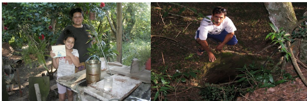
Figura 6 – Utilização de poços escavados e fontes nascentes.

fontes nascentes, a Figura 6 ilustra a utilização de um poço escavado e uma fonte nascente.