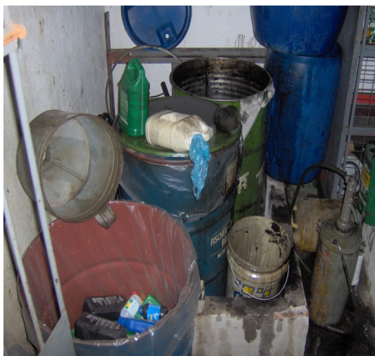
Figura 5 - Depósito de embalagens de óleo lubrificante e outros resíduos junto a poço tubular.

Dentre estas inconformidades estava o selo de vedação ou sanitário inadequado ou insuficiente, inexistência de laje de proteção, falta de tampa ou tampa inadequada, ausência de tubo guia, detectando-se também que em alguns locais havia presença de fezes de animais nos arredores, acumulação de lixo, embalagens descartadas de produtos químicos, etc. Todos esses fatores isolados ou em conjunto representam risco a saúde das pessoas que utilizam a água dessas fontes alternativas para consumo humano.