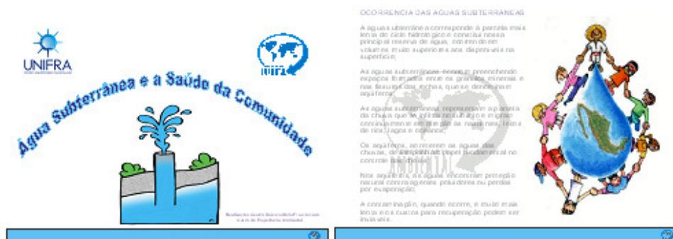
Figura 1 – Capa da cartilha e a segunda página que aborda a ocorrência da água subterrânea.

A cartilha “Água Subterrânea e a Saúde da Comunidade” foi elaborada a partir de revisão de literatura, procurando demonstrar os cuidados básicos para com os recursos hídricos subterrâneos e os riscos à saúde da população pelo consumo de água fora dos padrões de qualidade, adotando uma linguagem simplificada a fim de atingir todas as camadas da população em estudo. Foram abordados tópicos como a ocorrência da água subterrânea ilustrado na Figura 1.