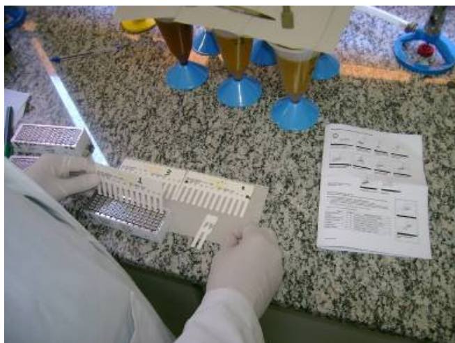
Figura 3 - Utilização do Teste ImmunoComb® para Hepatite A.