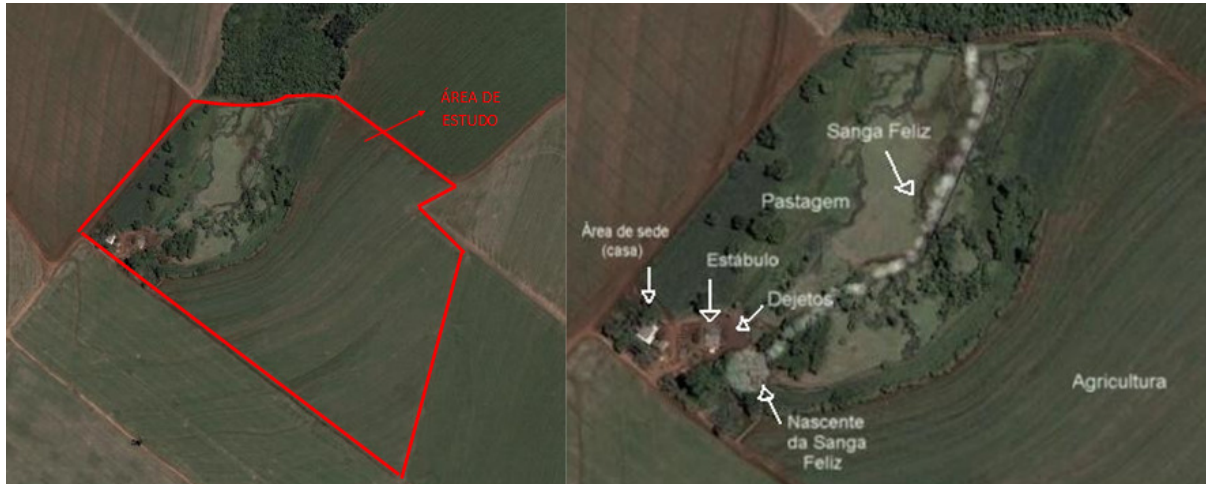
(a) propriedade rural em estudo