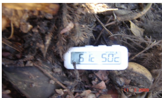
Figura 1. Leitura da temperatura interna da leira com termômetro digital.

C/N comparadas com o tempo de maturação de cada leira e a variáveis ambientais utilizadas. Em função da origem da matéria prima, sem risco da presença de contaminantes, não foram realizadas análises referentes a metais pesados. As contagens microbianas foram realizadas nos mesmos intervalos.