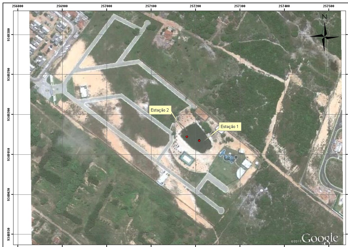
Figura 1 – Localização da Lagoa Objeto do Estudo.

A coleta foi realizada na manhã do dia 11 de agosto de 2011, sob um dia ensolarado com baixa umidade do ar. Foi constatado in loco , que o único afluente da lagoa são águas pluviais, e que não ocorre infiltração de tanques sépticos sépticas e sumidouros na área do condomínio (considerar um raio aproximado de 02 Kilômetros da lagoa), uma vez que a mesma é saneada, e toda a água residuária gerada pelo condomínio é tratada na